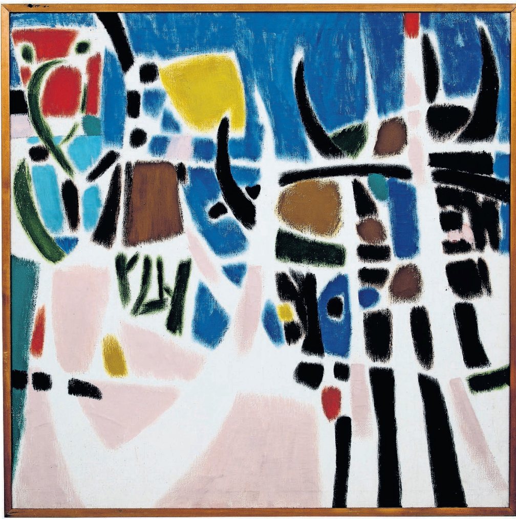
Links: 'Geiten achter hekken', 1953, olieverf op doek. Hieronder: '2 figuren', 1962, olieverf op doek.