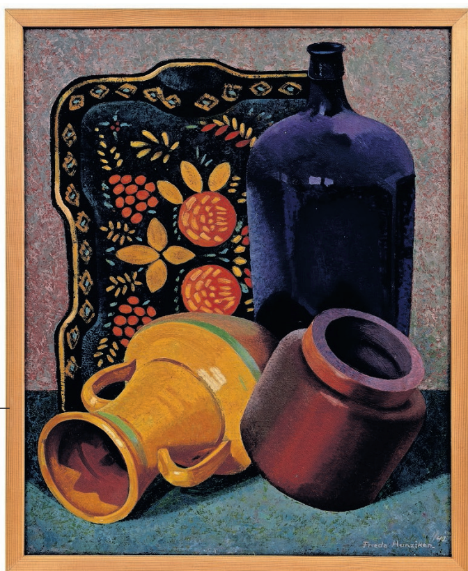
'Stilleven met blauwe fles', 1942, olieverf op doek.

Frieda Hunziker moest als vrouw knokken om kunstenaar te worden, maar in de jaren vijftig en zestig exposeerde ze naast Appel en Corneille. Toch raakte ze in de vergetelheid. Onterecht, laat een overzichtsexpositie zien.