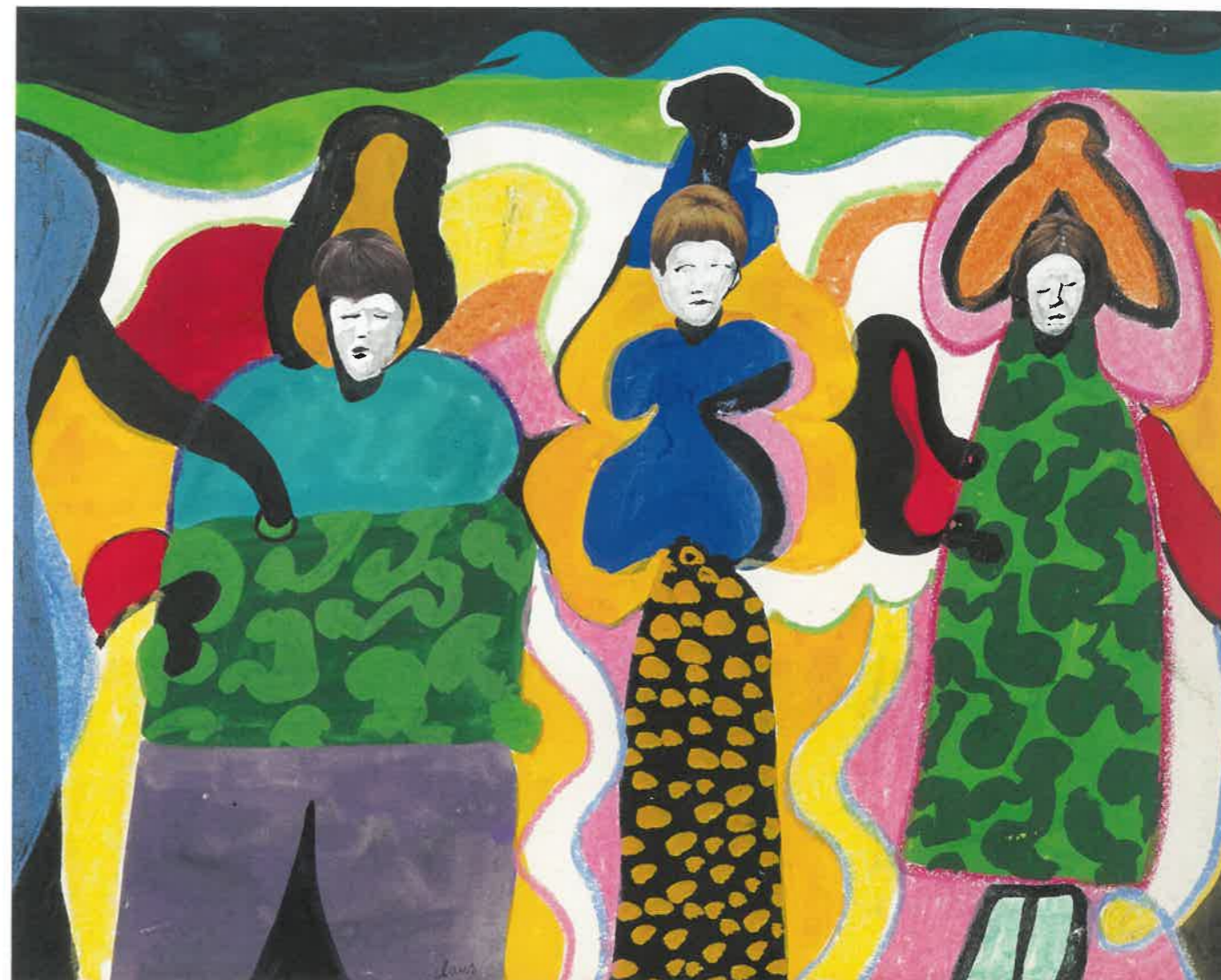
Untitled, inkt, waskrijt en gouache op papier, 28 x 35,7 cm, gesigneerd l.o. Prijs: € 12.500.

Van de traditionele schildersezel maakte Claus geen gebruik. De schrijvende schilder verkeerde het meest in zijn element als zijn verbeelding het met verf, inkt, of houtskool van hem overnam. Het liefst zittend op de grond, gehurkt, geknield of leunend op een tafel. Het schilderen maakte hem rustig. Zoals hij het zelf ooit zo treffend omschreef: "Schilderen is een van de manieren om de lasten van het schrijverschap te ontvluchten." Veelzeggend is wat Claus vertelde aan de Vlaamse dichter-journalist Willem M. Roggeman van de Vlaamse Gids. "Ik schilder praktisch elke dag. Ik ben het altijd blijven doen. Eenzelfde verwarring en versnippering is gaande in wat ik schilder als in mijn schrijven. Ook daar ben ik niet vast te prikken op één stijl of één figuur. Ik ben blijven schilderen omdat, als je een paar uur gebogen zit over een tafel, je behoefte hebt aan iets speelsers, iets wat niet het denkwerk op de proef stelt."