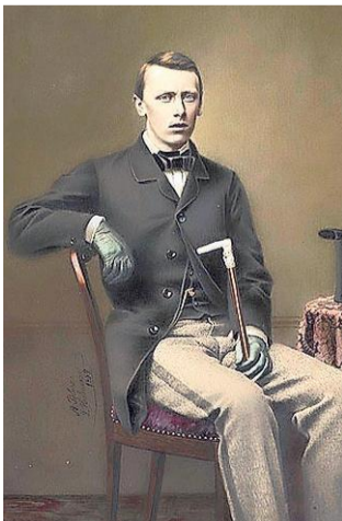
Kroonprins Willem alias Wiwil.

De jonge prins van Oranje was intelligent, maar door luiheid en ondeugend gedrag haalde hij maar matige studieresultaten op kostschool Noorthey in Veur, bij Voorschoten. Reeds op zijn