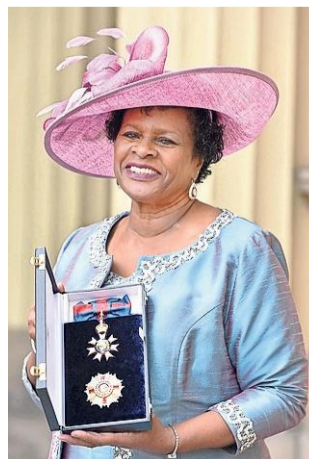
Dame Sandra Mason is in Barbados gekozen tot eerste president.

Koningin Elizabeth moet het op 95-jarige leeftijd nog meemaken dat zij wordt afgezet als staatshoofd. Het Caribische eiland Barbados zal vanaf 30 november namelijk de status krijgen van republiek. De allereerste gekozen president wordt Dame Sandra Mason (72), die al sinds 2018 gouverneur-generaal was. De datum van 30 november markeert de 55e verjaardag van de onafhankelijkheid van Barbados van Groot-Brittannië.